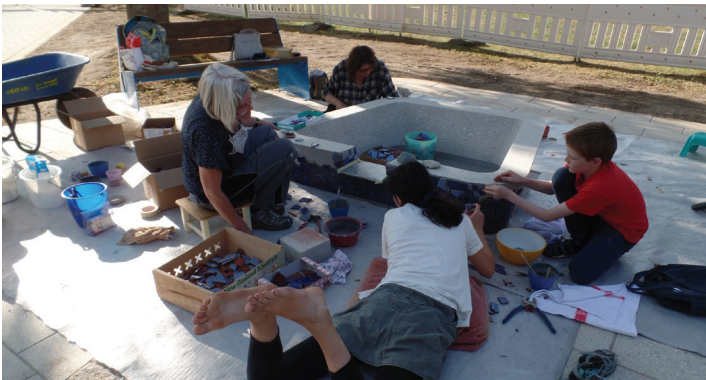
Gemeinsames legen der vielen Mosaiksteinchen